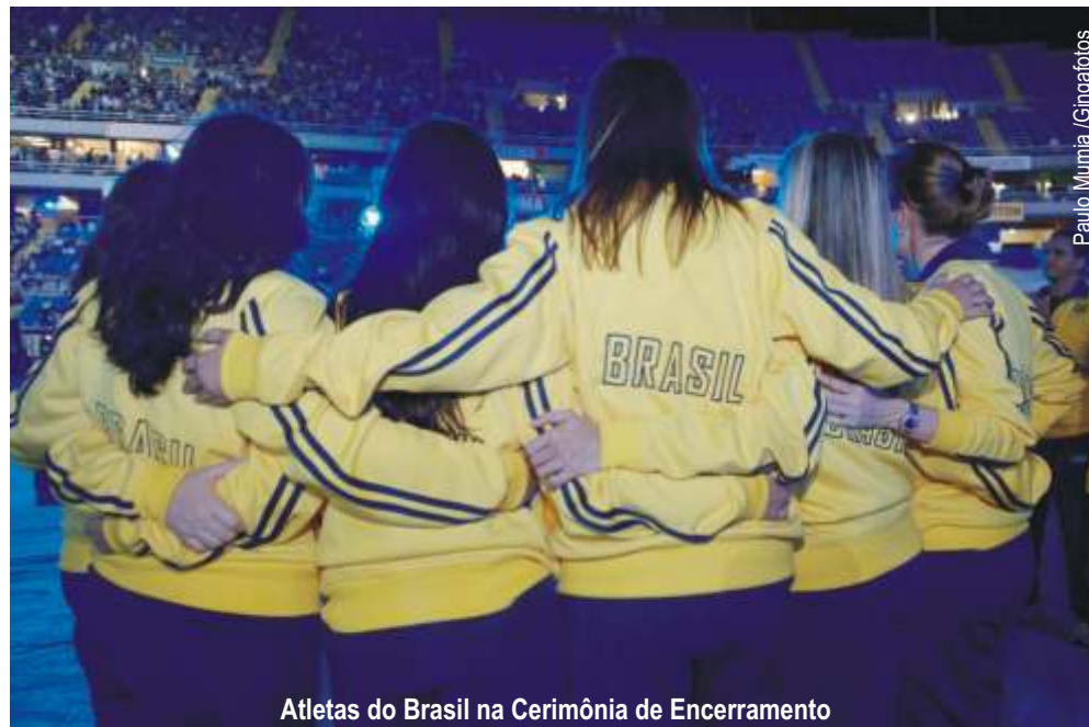
Atletas do Brasil na Cerimônia de Encerramento

Ao todo foram realizadas 194 finais das 20 modalidades em disputa, com a distribuição de 459 medalhas de ouro, 459 de prata e 503 de bronze.