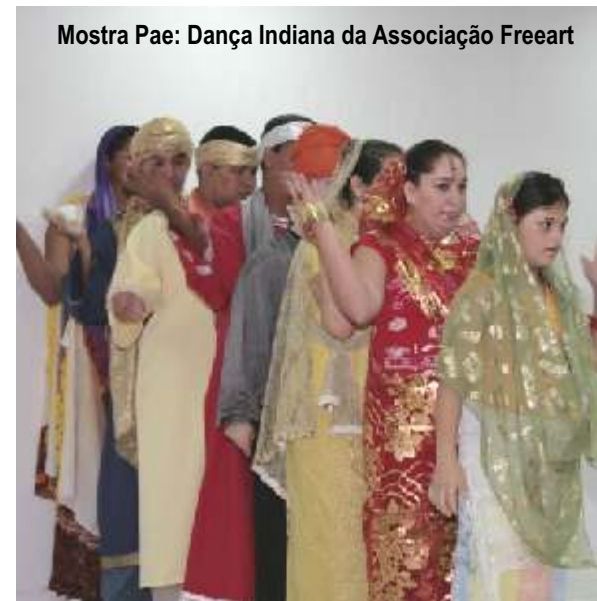
Mostra Pae: Dança Indiana da Associação Freeart

O objetivo do Projeto é proporcionar aos militares, servidores civis e seus dependentes, condições de apoio e esclarecimento sobre o processo de inclusão social dos portadores de necessidades especiais da Família Naval. Em 2009, somente na área do 1º DN, foram atendidos cerca de 450 usuários e suas famílias, o que totaliza uma média de 1.800 pessoas. O programa envolve o credenciamento de 34 clínicas e participação de três OM - Diretoria de Assistência Social da Marinha (DASM), Serviço de Assistência Social da Marinha (SASM) e a Policlínica Naval Nossa Senhora da Glória, por meio do Grupo de Avaliação e Acompanhamento de Pacientes Especiais.