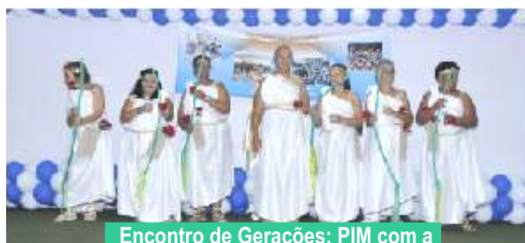
Encontro de Gerações: PIM com a apresentação Greco-Romana

A magia do circo deu início à festa, com a apresentação-espetáculo dos alunos do Projeto Adolecer, seguidos dos pequeninos do Centro de Recreação Infantil Pequenos Grumetes (CRIPQ), que encantaram a platéia com coreografias da década de 60, onde reviveram os tempos